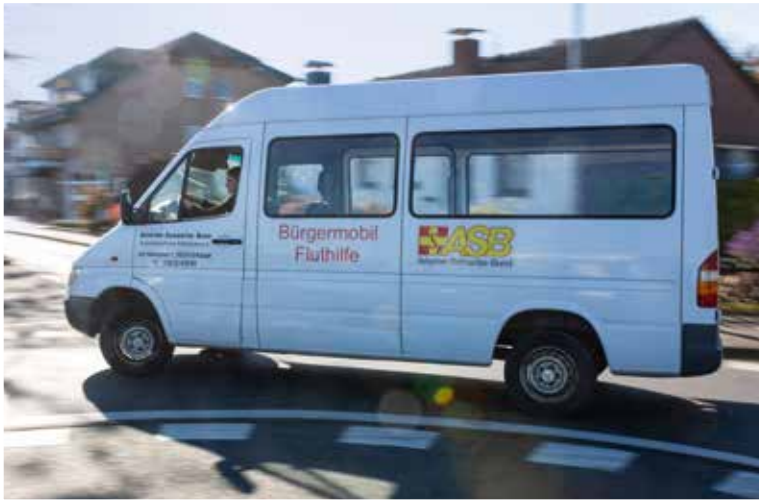
Das Bürgermobil kann von Betroffenen der Flutkatastrophe, die ihr Auto verloren haben, ohne Mietkosten ausgeliehen werden.