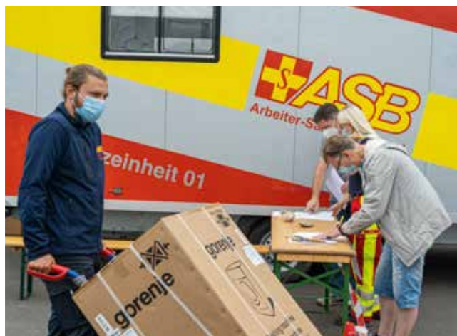
Der ASB Rhein-Erft/Düren verteilt Bautrockner, Hochdruckreiniger, Waschmaschinen und Kühlschränke an Betroffene.