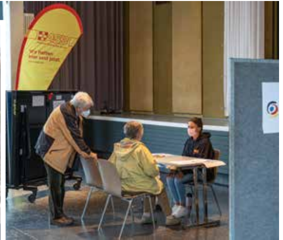
In Erfstadt werden Soforthilfen für Anwohner*innen betroffener Stadtteile ausgezahlt.

>> Bürger*innen, die durch die Flut ihr Auto verloren haben, können das Fahrzeug ohne Mietkosten ausleihen, zum Beispiel um mobilitätseingeschränkte Angehörige zu befördern oder Bau- und Renovierungsmaterial zu transportieren.