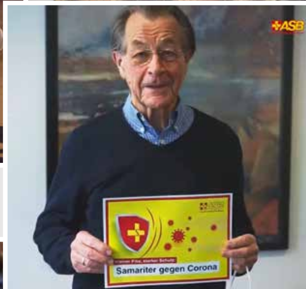
Oben: Franz Müntefering weiß genau, worauf es ankommt: Impfungen haben in der Vergangenheit bereits Millionen Menschen vor Krankheiten bewahrt und werden es auch in dieser Pandemie tun.