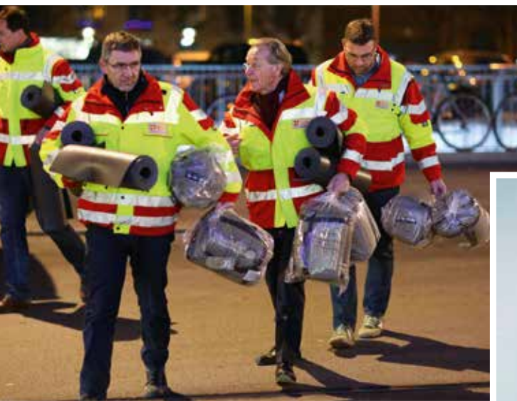
Oben: Franz Müntefering setzt sich mit Tatkraft bei den ASB-Kältehilfen ein. Hier verteilt er gemeinsam mit Mitgliedern des Bundesvorstands und des LV Berlin Schlafsäcke und Isomatten an Obdachlose.