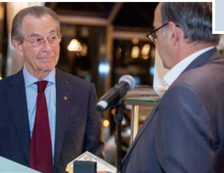
Links: ASB-Bundesvorsitzender Knut Fleckenstein überreicht am 24. Oktober 2021 Franz Müntefering zum Abschied für besondere Verdienste um die Förderung des Arbeiter-Samariter-Bundes zur Verwirklichung humanitärer Ziele das ASB-Ehrenkreuz in Gold.