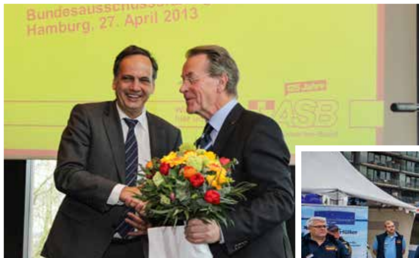
Links: Knut Fleckenstein gratuliert Franz Müntefering nach dessen Ernennung zum ASB-Präsidenten am 27. April 2013.