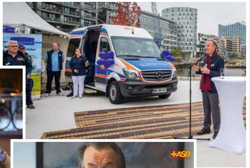
Unten: Als Schirmherr des Wünschewagens unterwegs: Franz Müntefering bei der Feier zum Start des Wünschewagens in Hamburg am 14. Oktober 2017.