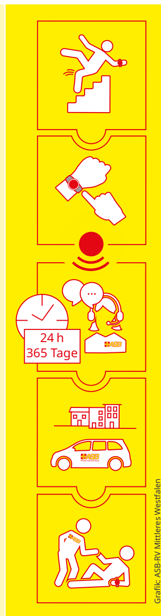
Grafik: ASB-RV Mittleres Westfalen

Der ASB-Hausnotruf bietet auf Wunsch die Möglichkeit einer „Tagesmeldung“. Dabei können Hausnotrufteilnehmer:innen ein- oder mehrmals täglich bestätigen, dass es ihnen gut geht. Erfolgt die Meldung nicht, fragen die Mitarbeiter:innen nach oder schicken jemanden vorbei.