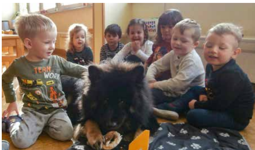
Im Kreise der Gratulant*innen: Kindergartenhund Gino feiert seinen ersten Geburtstag.