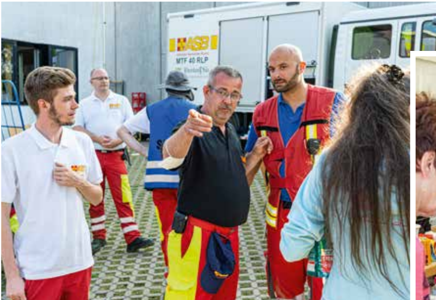
Einsatzkoordination der Samariter*innen in Rheinland-Pfalz und Verpflegung der Menschen in den Flutgebieten des Ahrtales.