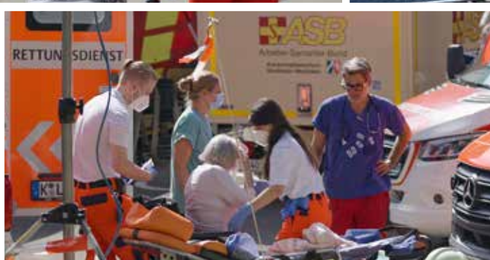
Die Rettung und Versorgung von Flutopfern sowie die Betreuung Evakuierter in Notunterkünften standen an erster Stelle.