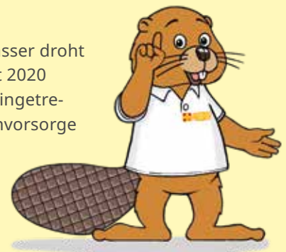
Illustration: ASB/K. Maibaum

ten, ist es für die Krisenvorsorge meist zu spät. Zur Krisenvorsorge gehört daher eine vorausschauende Planung und Vorbereitung auf den Ernstfall. Bei uns kann jeder vom Kita-Kind bis zum/zur Rentner:in lernen, wie man sich auf eine Katastrophe vorbereitet. Kurse in Ihrer Nähe finden Sie unter: www.asb.de/ehsh